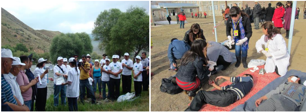
Աղետների ռիսկերի մասնակցային նվազեցման ծրագիր